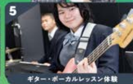
ギター・ボーカルレッスン体験