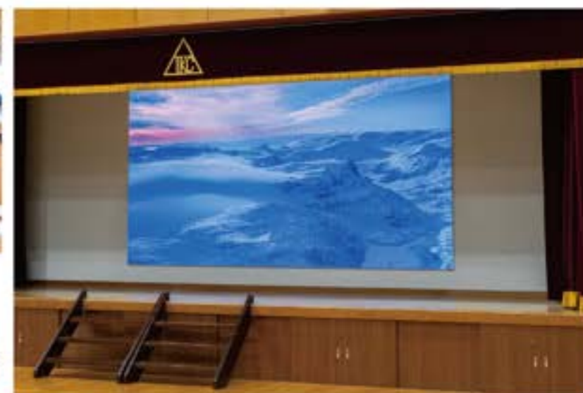
体育館（サイネージ有）