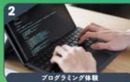
プログラミング体験