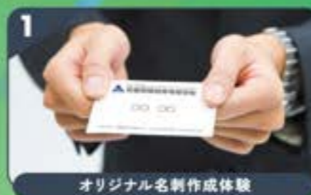
オリジナル名刺作成体験

7/4± 9/12± 10/3± 10/24± 11/14± 11/28± 12/5± 12/12± 12/19± 2027 1/16±