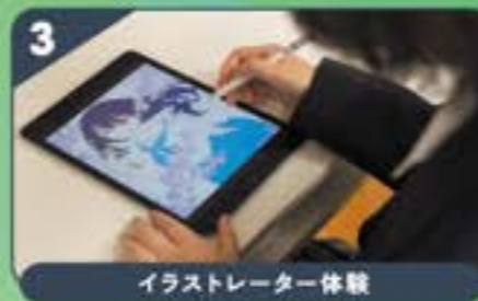
イラストレーター体験