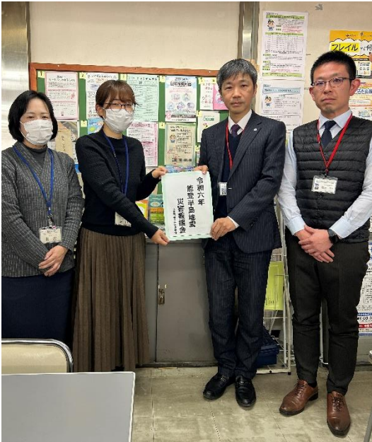
1月24日(木)午前 枚方市健康福祉政策課にて